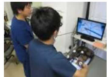
腹腔鏡シミュレーター

「メディカルオンライン」、「医中誌Web」、「UpToDate」を利用でき、閲覧できる文献が豊富です。医局及び研修医室内は、Wi-Fi環境が整っています。