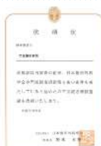
日本整形外科学会 研修施設