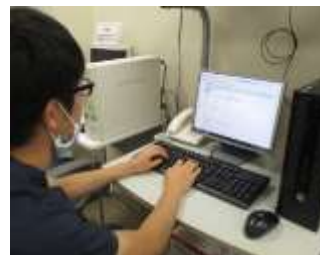
インターネット環境

研修医室があり、研修医ひとりに1台の机と電子カルテ端末が設置されています。完全電子カルテですので、研修医室にいながら検査Dataや画像をチェックし、カルテ記載ができます。