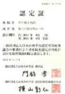
日本内科学会 教育関連認定施設