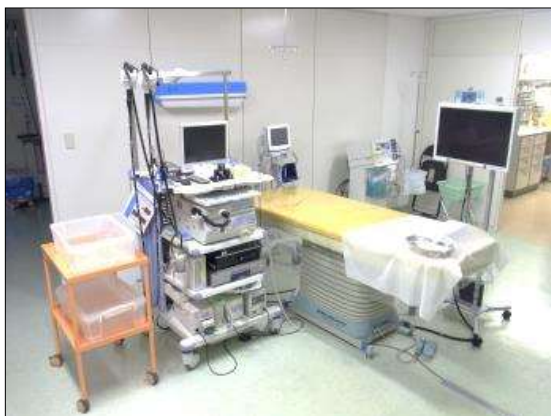
県内トップレベルの消化器センター