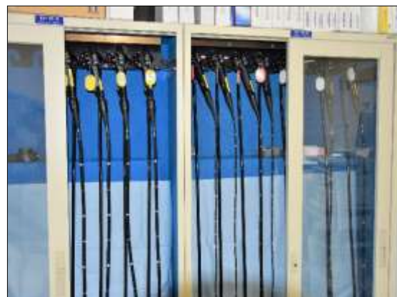
最新機種の内視鏡

消化器疾患全般に対応できる消化器センターを平成22年に設置しました。患者さんにとって最適の治療法をめざし質の高い医療の提供を常に目指しています。特に食道・胃・大腸の早期がんに対する粘膜下層剥離術は年々増加しており、他地域から紹介される症例が増えています。肝胆膵の分野では、腹部超音波診断のレベルが高く、肝炎から肝硬変、肝がんに至るまで、放射線科医と協力して自院で完結した治療を行っています。また、外科との連携で腹部の救急に力を入れており、より速く正確な診断と患者さんにとって十分かつ最も負担の少ない治療を目指しています。