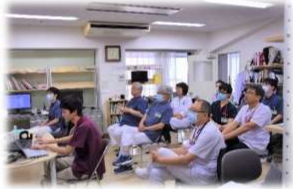
研修医症例検討会

年間を通じて毎月第1・第3火曜日に研修医を対象とした症例検討会を、毎週金曜日には研修医勉強会を開催し、経験豊富な各科の指導医が現場で役立つ実践的な知識・技術を伝授しています。