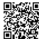
研修医募集QRコード