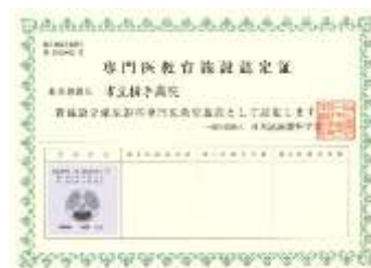
日本泌尿器科学会 専門医教育施設