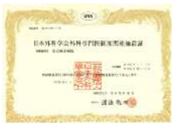
日本外科学会 専門医制度関連施設