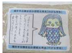
アマビエのイラストは5種類ありました。