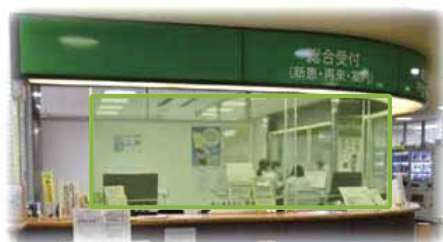
色が塗られているところにアクリル板を設置しています。会計窓口まで、全面に設置しております。

受付、会計、外来など各窓口にてパーテーションを設置し、飛沫感染を防ぐ対応をしております。