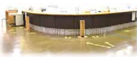
床に足形を貼って目印をつけています。

総合受付、会計受付前では、距離をあけてお待ちいただけるように足元に目印をつけております。